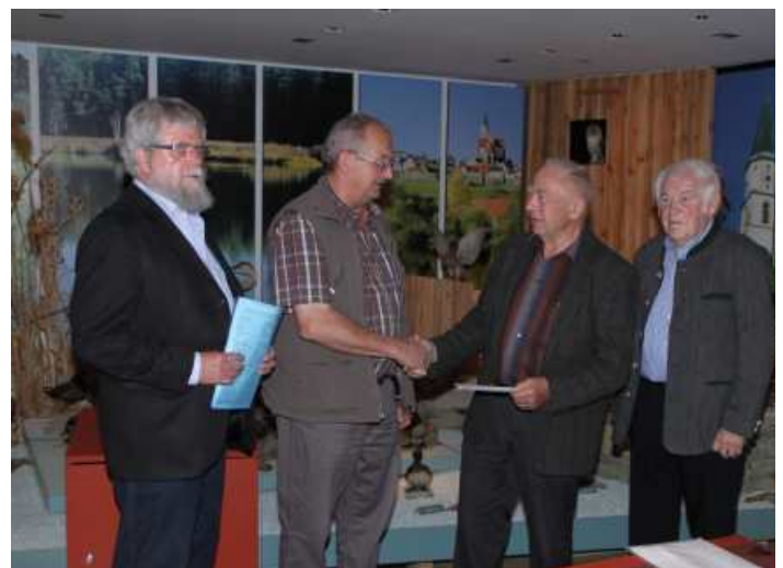
Die Stiftung "Der silberne Bruch" überraschte die Ameisenfreunde in Nabburg mit einer großzügigen Spende. Vielen Dank dafür.