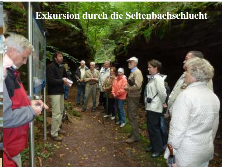
Exkursion durch die Seltenbachschlucht