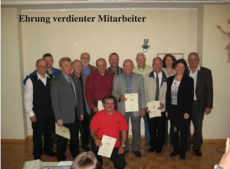
Ehrung verdienter Mitarbeiter