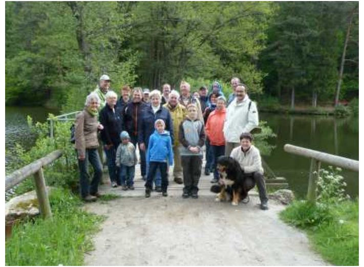
Zusammen mit dem BUND und LBV trafen sich die Ameisenfreunde zum Tag der Natur. Die Exkursion führte die Teilnehmer rund um den Hammersee in Bodenwöhr