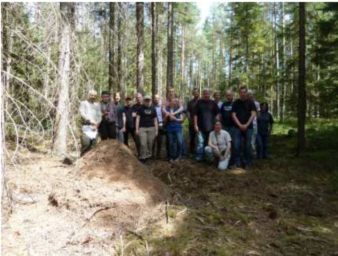
Das Ameisenseminar in Nabburg war wieder mal komplett ausgebucht. Bild: Teilnehmer bei der Exkursion im Oberpfälzer Seenland bei Wackersdorf